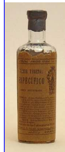
Elixir Vegetal de San Joaquín