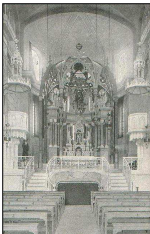
Altar major abans de 1936

Va ser un moment de grans pèrdues personals per tot el poble i ho va ser també pels Mínims.