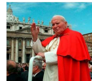
San Juan Pablo II – 22 de octubre Coincidiendo con inicio su pontificado 22-octubre-1978