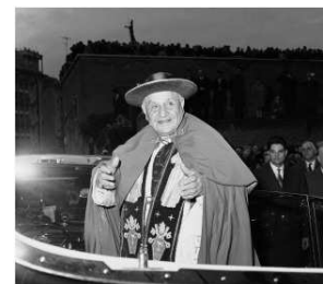
San Juan XXIII – 11 de octubre Coincidiendo con inicio Concilio Vaticano II 11-octubre-1962

Los papas Juan XXIII y Juan Pablo II ya figuran en el Santoral oficial de la Iglesia Católica.