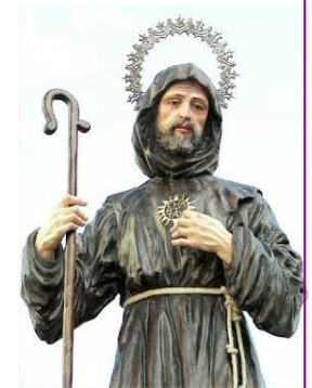
San Francisco de Paula

(de la “vida de San Francisco de Paula escrita por un anónimo discípulo contemporáneo”)